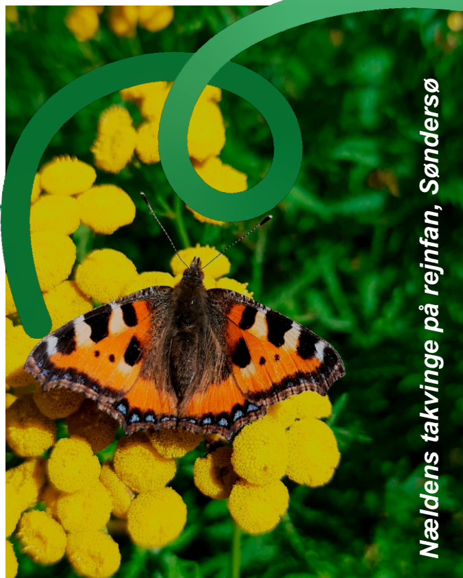
Nældens takvinge på rejnfan, Sønderlø

Men en art som okkergul pletvinge lægger sine æg på forskellige arter af vejbred, som har det svært i konkurrencen med brændenælde, græsser med videre. Bl.a. derfor går okkergul pletvinge hastigt tilbage, mens nældens takvinge klarer sig udmærket.